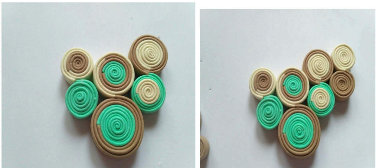
фото 8 а,б

Склейте отримані конструкції між собою (фото 8а). Додайте спіралі різних розмірів та кольорів, приклеюючи їх до вже наявних (фото 8б)