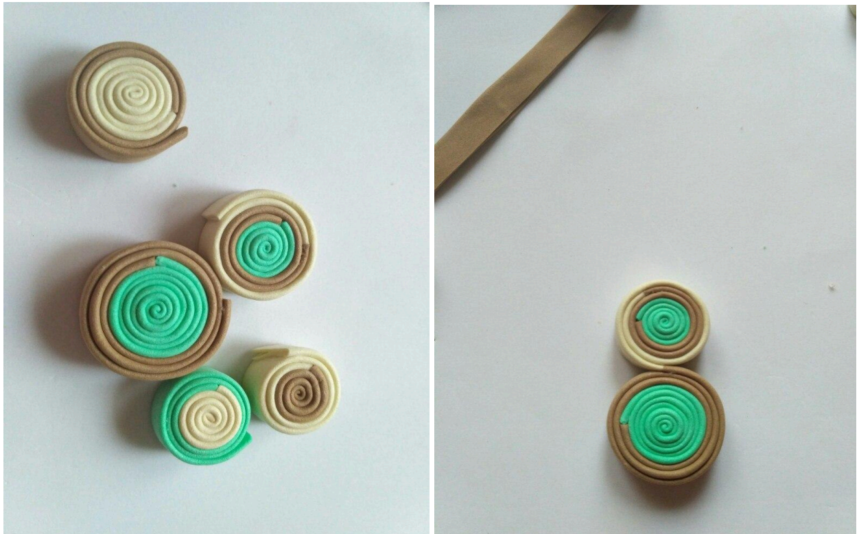
фото 7 а,б

Склейте отримані конструкції між собою (фото 8а). Додайте спіралі різних розмірів та кольорів, приклеюючи їх до вже наявних (фото 8б)