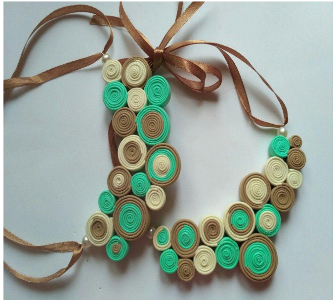
фото 10 а,б

Зав'яжіть стрічки в бант між собою (фото 10б). Кольє готове!