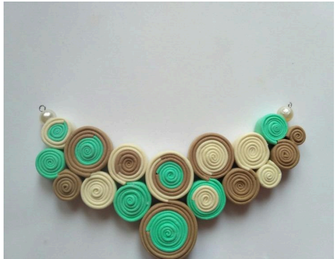
фото 9 а,б

Розріжте стрічку навпіл, протягніть половини крізь вушка пінів і протягніть до середини (фото 10а).